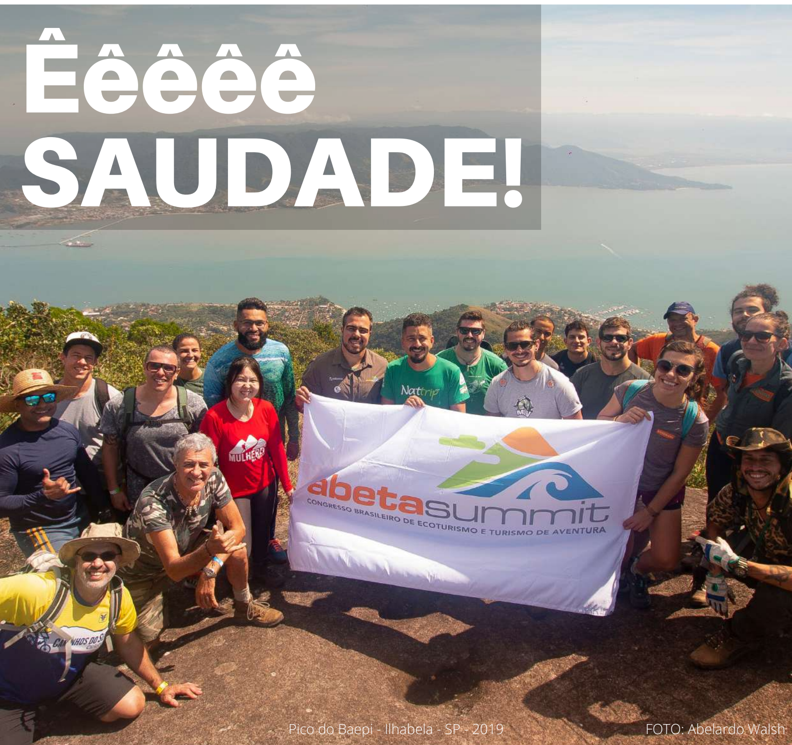
Pico do Baepi - Ilhabela - SP - 2019